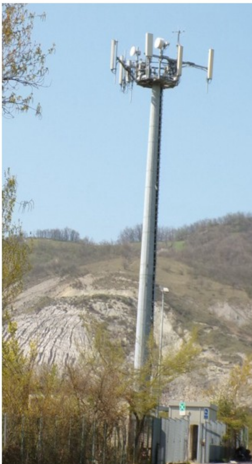
STAZIONE RADIO BASE VODAFONE SULLA QUALE SI ANDRA' AD EFFETTUARE L'INTERVENTO