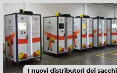
I nuovi distributori dei sacchi