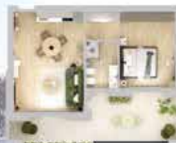
2 LOCALI CON TERRAZZO