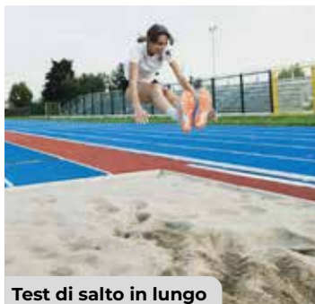
Test di salto in lungo

L'importo totale del quadro economico rimane invariato a 2.800.000 euro, provenienti da risorse finanziate dal PNRR.