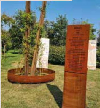
Il nuovo monumento

È stato inaugurato in occasione della prima Giornata Nazionale degli Internati Militari Italiani - IMI , lo scorso 20 settembre, il Monumento dedicato ai 650 mila Internati Militari Italiani deportati nei lager nazisti.