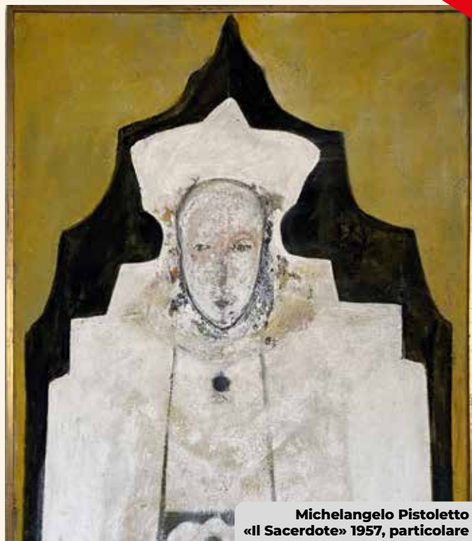
Michelangelo Pistoletto «Il Sacerdote» 1957, particolare

L'intento dell'esposizione è offrire ai visitatori un' esperienza multidimensionale capace di mettere in relazione arte , spiritualità e religioni sullo sfondo dell'idea-impegno di Michelangelo Pistoletto della Pace preventiva. Lo scopo è far emergere il ruolo dell' arte come linguaggio universale , capace di promuovere armonia, convivenza pacifica e