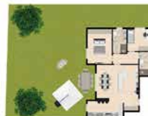
3 LOCALI + SERVIZI E GIARDINO

SITUATA IN UN PUNTO STRATEGICO DELLA CITTÀ, IMMERSO IN UN' OASI DI VERDE LONTANO DAI RUMORI DEL TRAFFICO, SENZA RINUNCIARE AI SERVIZI DEI NEGOZI DI VICINATO. APPARTAMENTI IN PRONTA CONSEGNA, 2 E 3 LOCALI CON GIARDINO PRIVATO O TERRAZZO.