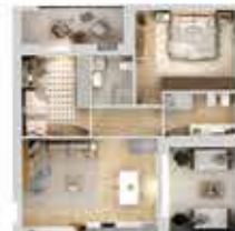
3 LOCALI CON TERRAZZO

NUOVA ED ELEGANTE COSTRUZIONE NEL RESIDENZIALE QUARTIERE DI SAN FRUTTUOSO. COMPOSTA DA 13 APPARTAMENTI, 2-3-4 LOCALI, CON GIARDINI PRIVATI AL PIANO TERRA, PRIMI PIANI CON TERRAZZI E LUSUOSI ATTICI CON AMPI TERRAZZI E VASCA IDROMASSAGGIO