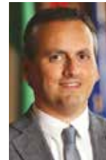
Villa Simone capogruppo