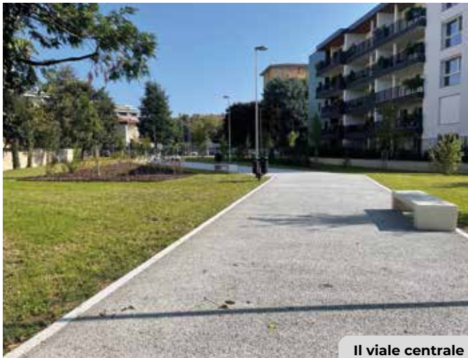
Il viale centrale

Oltre al giardino, l'intervento ha incluso la riasfaltatura del marciapiede esistente in via Spallanzani - per una lunghezza di circa 55 metri - e la prosecuzione del marciapiede di fronte al nuovo giardino, per circa 70 metri lineari. Qui sono state inserite 11 nuove alberature con aiuole, illuminazione con sistemi di telecontrollo e una nuova area di sosta con 19 posti auto regolamentati.