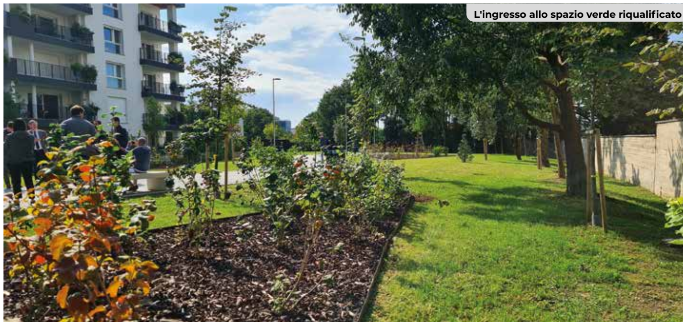
L'ingresso allo spazio verde riqualificato