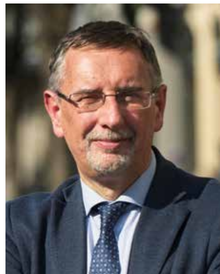
PAOLO PILOTTO | Sindaco di Monza

C antieri aperti, progetti in corso, spazi riconsegnati ai cittadini al termine dei lavori. In questo numero di Tua Monza presentiamo alcune delle attività su cui siamo impegnati in queste settimane, sapendo che molte altre opere sono state avviate e presto saranno visibili in città.