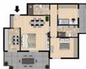
3 LOCALI + SERVIZI E TERRAZZO