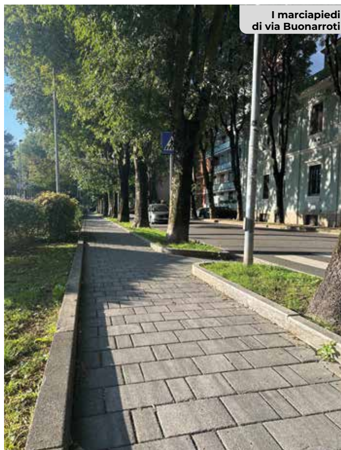
I marciapiedi di via Buonarroti

via Manzoni e altre arterie significative.