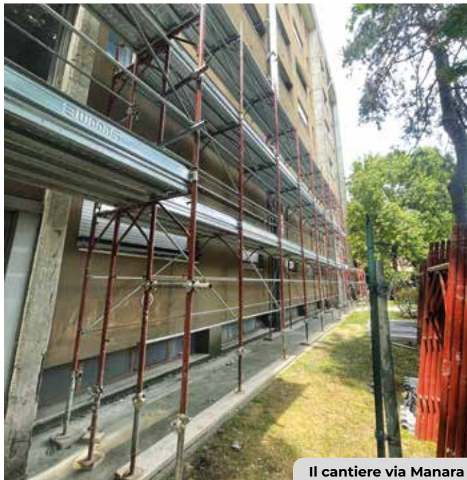
Il cantiere via Manara

Gli impianti fotovoltaici installati, in particolare, avranno una potenza complessiva di 19,20 kW : grazie a questa dotazione potranno