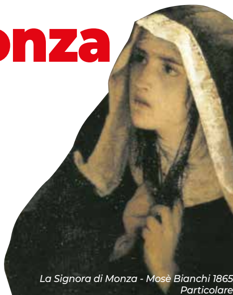
La Signora di Monza - Mosè Bianchi 1865 Particolare