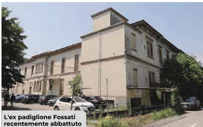
L'ex padiglione Fossati recentemente abbattuto

Il nuovo fabbricato che ospiterà le strutture sarà realizzato in corrispondenza dell'area in cui sorgeva il padiglione n. 36, ex Casa Fossati , un edificio costituito negli Anni Trenta che ospitava servizi sanitari, non da ultimo la scuola infermieri.