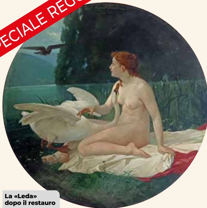
La «Leda» dopo il restauro