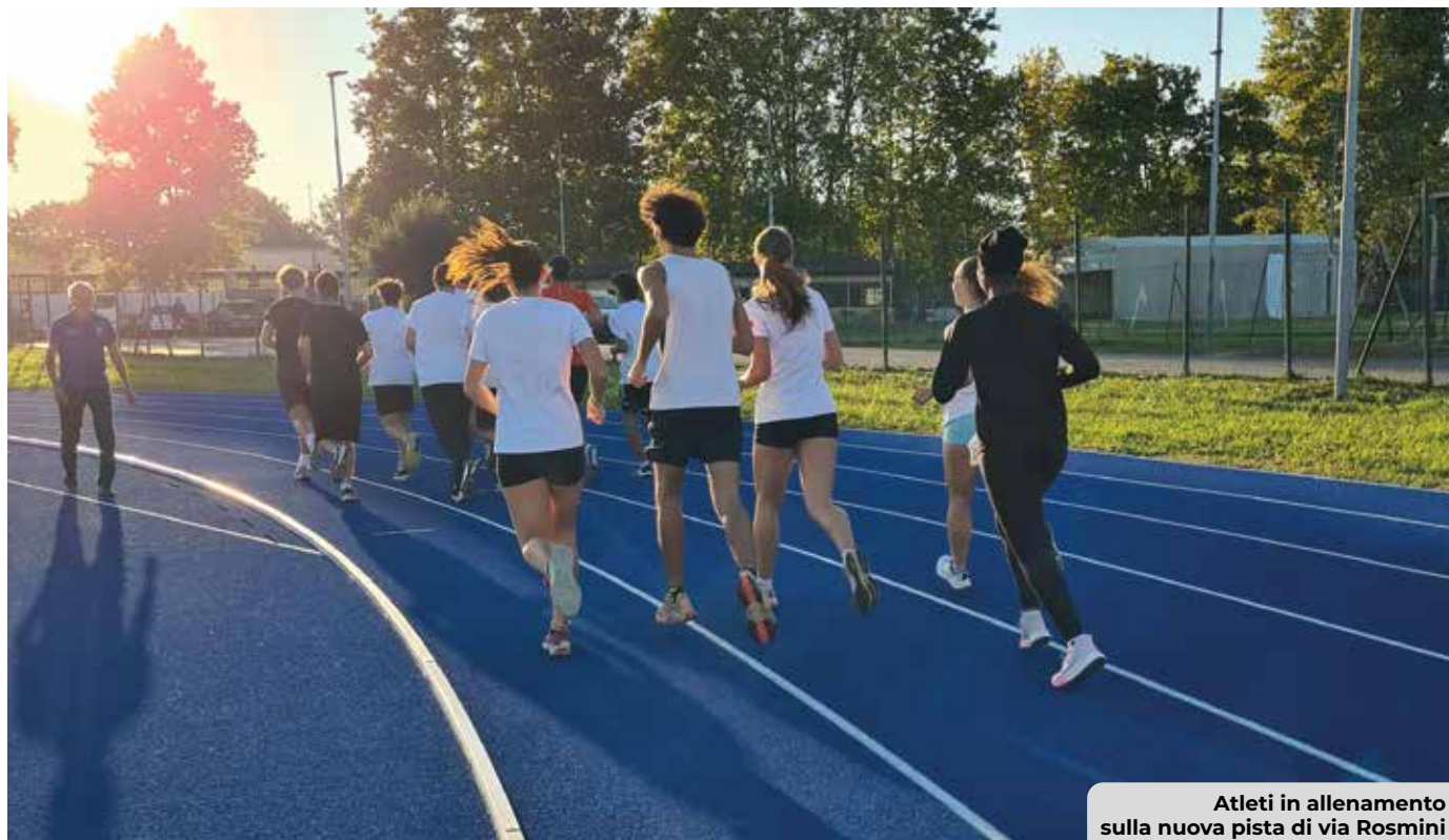
Atleti in allenamento sulla nuova pista di via Rosmini