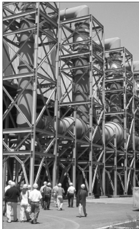
IMPIANTO DI BRESCIA DATI 2002