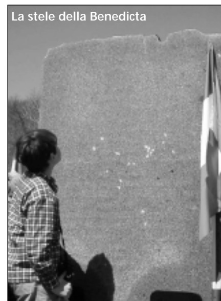
La stele della Benedicta

Infine, all'unanimità, è stato approvato un ordine del giorno in merito al rinnovo del contratto di lavoro dei dipendenti pubblici presentato dal gruppo consiliare del Partito dei Comunisti Italiani. Il documento invita l'Amministrazione Comunale a sollecitare l'Anici (Associazione Nazionale Comuni Italiani) affinché sia definito il rinnovo del contratto nazionale di lavoro, scaduto ormai da 17 mesi.