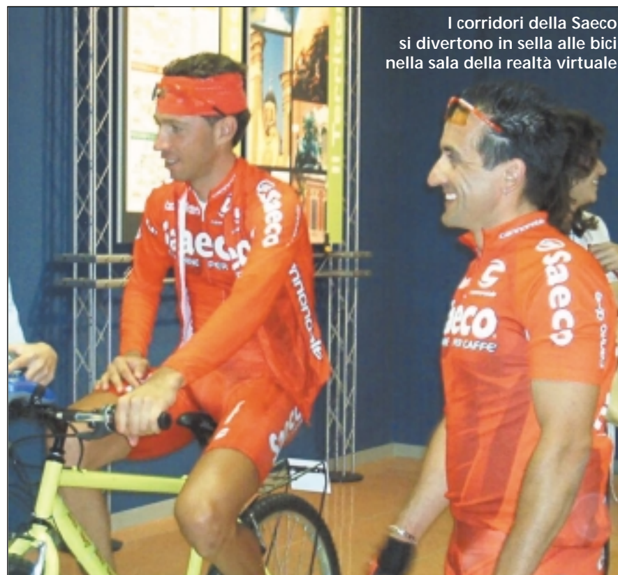
I corridori della Saeco si divertono in sella alle bici nella sala della realtà virtuale