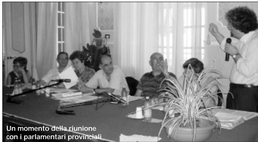
Un momento della riunione con i parlamentari provinciali

nanze di sgombero, indipendentemente dallo status di proprietario di immobile, almeno fino alla fine del mese di maggio 2003;