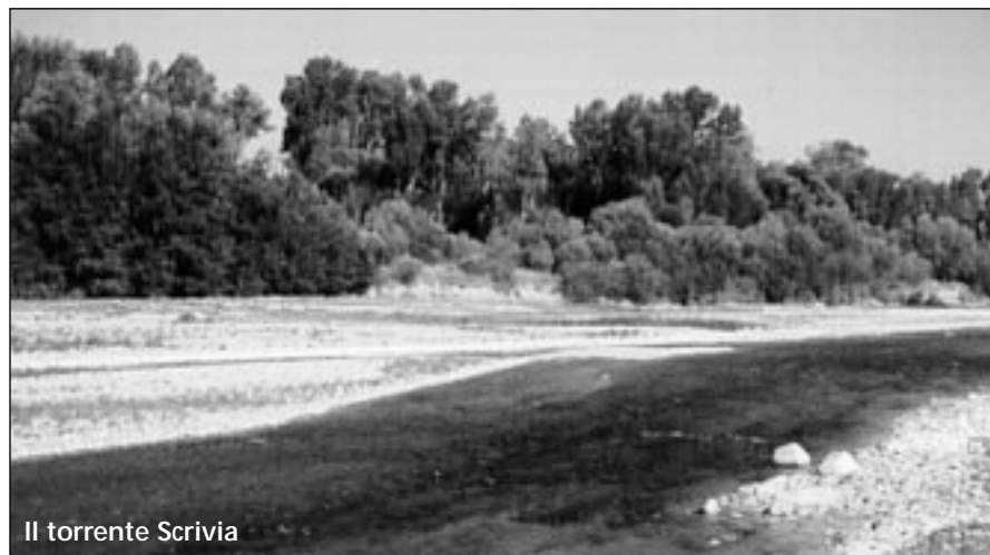
Il torrente Scrivia

Presentato in Consiglio Comunale il progetto di valorizzazione del torrente Scrivia. Approvata anche l'adesione all'Associazione "Memoria della Benedicta"