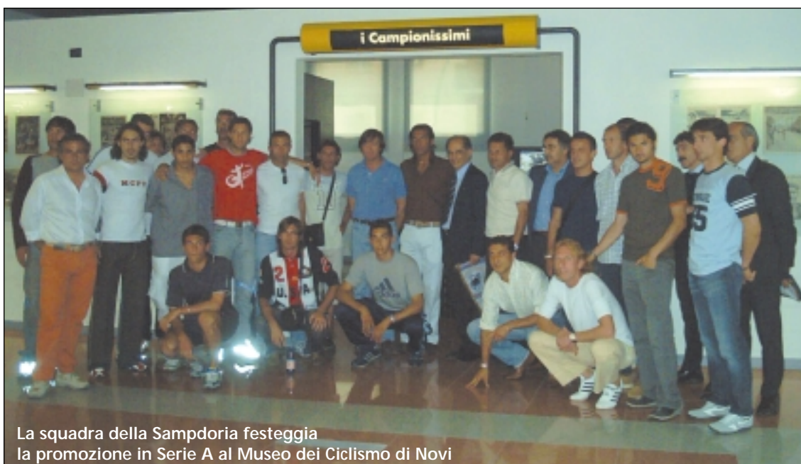
La squadra della Sampdoria festeggia la promozione in Serie A al Museo dei Ciclismo di Novi