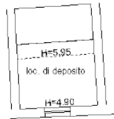
PIANO PRIMO SOPPALCO