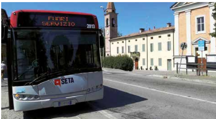
L'autobus in prova lungo la nuova linea Rubiera-San Faustino-Fontana

Sono proseguiti i lavori presso gli Orti Sociali , in zona laghetti di Calvetro: si concluderanno entro qualche settimana. Saranno messi a disposizione – anche in questo caso tramite bando pubblico – 30 orti, per anziani e per famiglie, in particolare quelle in difficoltà. Ci sono anche due orti particolari, sopraelevati, dedicati ai disabili: l'intera struttura sarà infatti accessibile anche in carrozzina, con apposito percorso e posti auto riservati. E' stato realizzato anche un pozzo per l'irri-