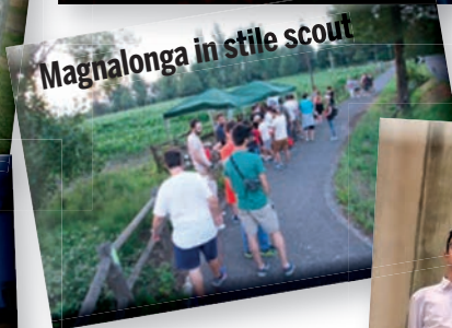
Magnalonga in stile scout