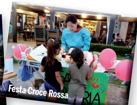
Festa Croce Rossa