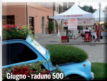
Giugno - raduno 500