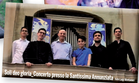
Soli deo gloria_Concerto presso la Santissima Annunziata