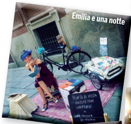
Emilia e una notte