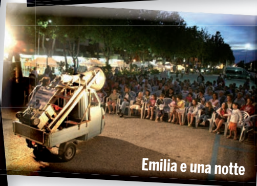
Emilia e una notte