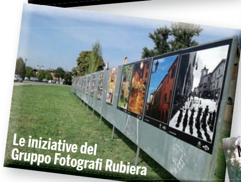
Le iniziative del Gruppo Fotografi Rubiera