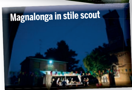
Magnalonga in stile scout