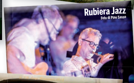
Rubiera Jazz