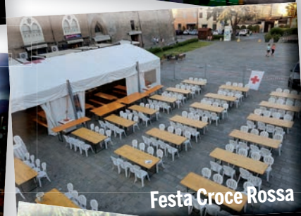
Festa Croce Rossa