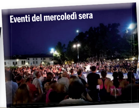
Eventi del mercoledì sera