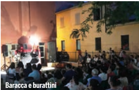
Baracca e burattini