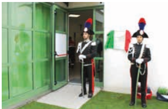
Inaugurazione nuova sede ANC

ha annunciato la firma dell'ultimo atto che ha dato esecutività alla realizzazione del complesso della Bretella . Insomma, una situazione che era ferma da diversi mesi si è sbloccata.