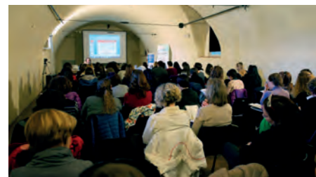
Convegno sulla matematica all'Ospitale