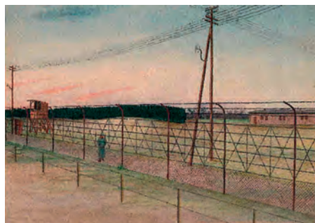
Mostra prigionieri dimenticati