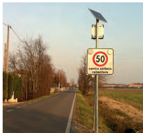
Via Paduli Lampeggiante