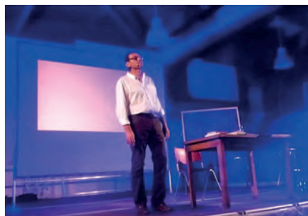
Spettacolo sul Presidente Pertini