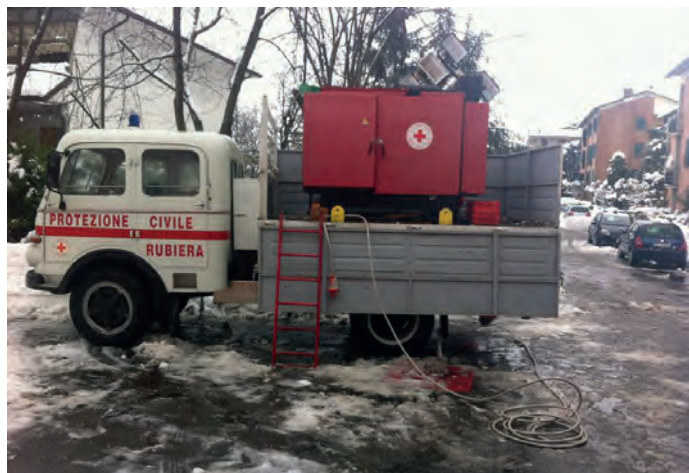
Generatore alla casa protetta di Rubiera

Danni dunque ingentissimi, sui quali l'Amministrazione comunale ha intenzione di impegnarsi affinché per lo meno la compagnia di gestione delle linee elettriche si faccia carico dei rimborsi previsti per i blackout così prolungati.