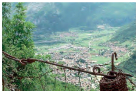
Il campo trincerato del Nagia Grom