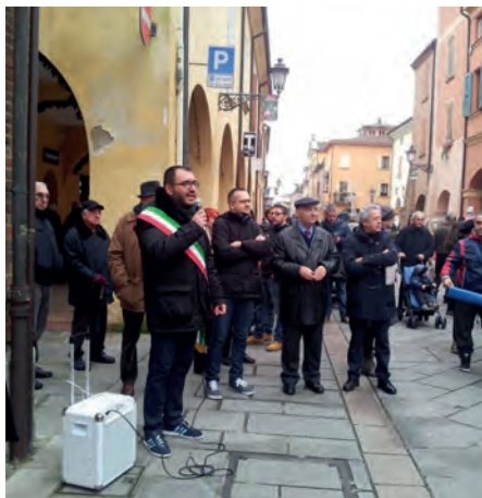
Inaugurazione del Wi-Fi