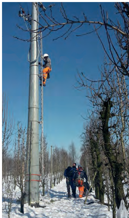
Blackout - Operai ENEL a Rubiera

Sono stati davvero pesantissimi i danni ed i disagi per la popolazione a seguito delle ingenti nevicate dei primi giorni di febbraio. I disservizi principali sono stati quelli legati alle migliaia di famiglie in tutto il territorio provinciale che hanno dovuto affrontare blackout prolungati, di molte ore ed addirittura di diversi giorni. Il territorio di Rubiera è stato uno dei più colpiti. A partire dalla notte tra giovedì 5 e venerdì 6 febbraio si sono accumulati tra i 40 ed i 50 centimetri di neve, una neve molto pesante che ha causato danni a moltissimi alberi, caduti o con rami spezzati, ed alle linee elettriche. Il 5 febbraio era già stata disposta la chiusura delle scuole, poi, a causa del perdurare delle interruzioni di energia elettrica, è stato convocato ed attivato il Centro Operativo Comunale di Protezione civile, che ha avuto un importante ruolo di sostegno alle famiglie in difficoltà, in primis tenendole aggiornate, anche attraverso social network, telefono, ma anche attraverso una auto dotata di megafono, sull'evoluzione dell'emergenza, e sulla possibilità di usufruire dei centri di ospitalità predisposti in alberghi ed al centro di volontariato Ponte Luna per il pernottamento di chi è stato costretto a rimanere per più giorni