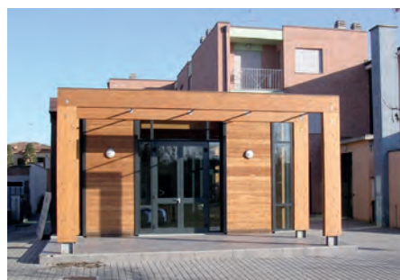
Centro giovani Rubiera

Via Terraglio; il 10 giugno (Al)Cool, al pomeriggio in Piazza del Popolo, iniziativa di educazione stradale a cura dei Pionieri della Cri e Gruppo scout; il 23 giugno e il 21 luglio Cinestate, alla sera proiezione di film nel cortile della Biblioteca comunale; il 15, 22 e 29 giugno, e il 6, 13 e 20 luglio Rubiera Summer Cup. Sei lunedì sera di giochi sportivi per i giovani negli impianti di Rubiera, in collaborazione con le società sportive; nei mesi di giugno e luglio Web Night Cafe, 3 serate di musica nel cortile della Biblioteca comunale e in Piazza del Popolo a cura di Associazione Culturale Eclettica.