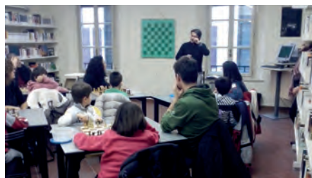
Corso di scacchi alla Biblioteca Codro

Sono state avviate collaborazioni con le università ed esperti nel campo, promosse attività di formazione per potenziare le conoscenze adulte e lo sviluppo della ricerca e della sperimentazione intorno a metodologie favorevoli all'attivazione di una didattica efficace, con particolare attenzione all'impiego di nuove tecnologie. In particolare le esperienze condotte nei servizi 0/3 anni sono state rielaborate con la collaborazione della prof.ssa