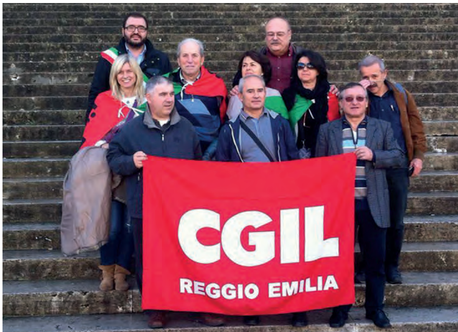
Eternit - Assemblea a Casale Monferrato

La politica si era presa degli impegni in tal senso e speriamo che se ne vedano i frutti".