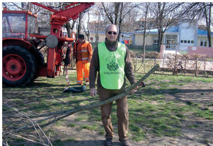
Un volontario civico. E' possibile dare la propria disponibilità contattando l'URP del Comune