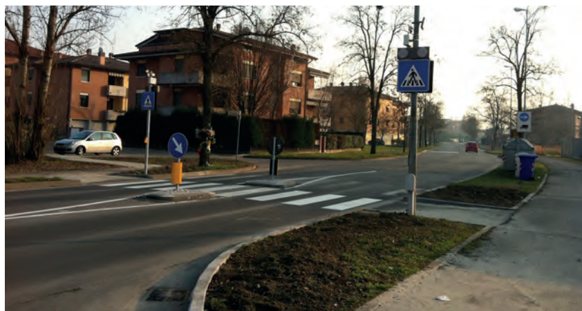
Modifica attraversamento Via Togliatti