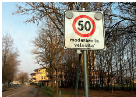
Via Aldo Moro Lampeggiante

Questi attraversamenti sono dotati di isole salvagente a centro carreggiata e del sistema "safety-cross" per il rilevamento della presenza del pedone con attivazione dei lampeggianti che avvertono l'automobilista del pericolo. E' stato realizzato un nuovo attraversamento pedonale in Viale Matteotti all'altezza della pizzeria Liberty, anche questo di tipo protetto con isole salvagente.