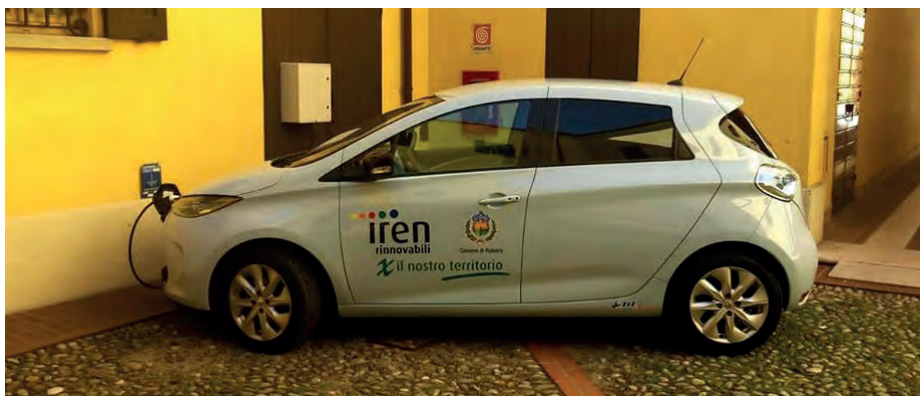
La nuova Renault Zoe a disposizione del Comune di Rubiera

Iren Rinnovabili e sarà a disposizione del Comune per quattro anni. Si tratta del primo veicolo a energia rinnovabile a disposizione dell'ente.