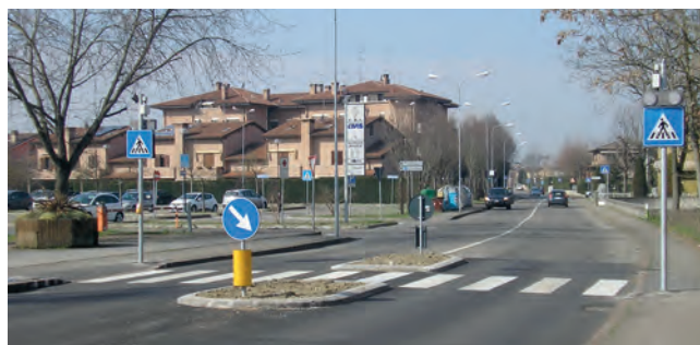
Via De Gasperi Modifica attraversamento