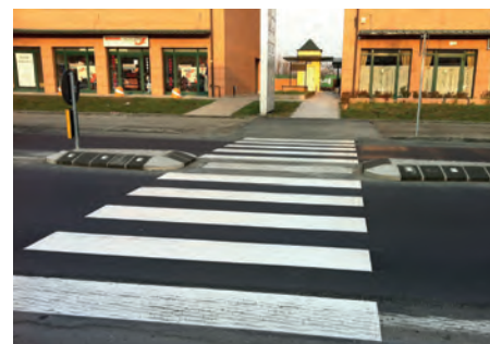
Nuovo attraversamento Viale Matteotti