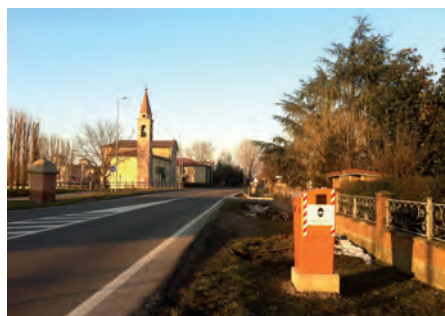
Prevelox SP85 Fontana