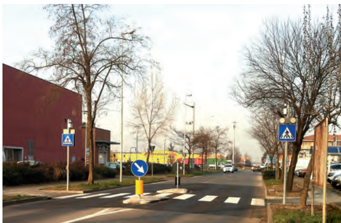
Nuovo attraversamento Via Togliatti Emiro