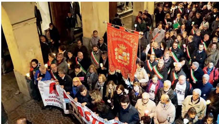
Eternit - Manifestazione Casale Monferrato

CONCESSIONARIA LANCIA FIAT FIAT PROFESSIONAL SERVICE MOPAR ABARTH F.I.I. BONACINI