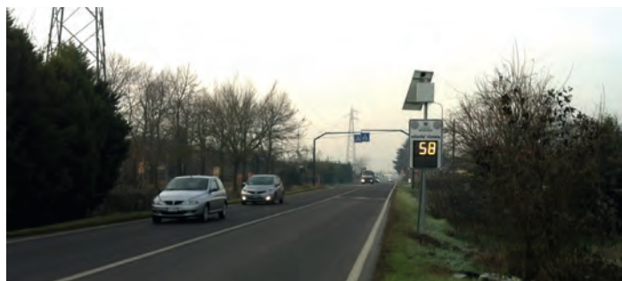
Display SP51 Quartiere Contea

Altri interventi verranno realizzati, con un investimento di oltre 60.000 euro ulteriori, da qui al 2016