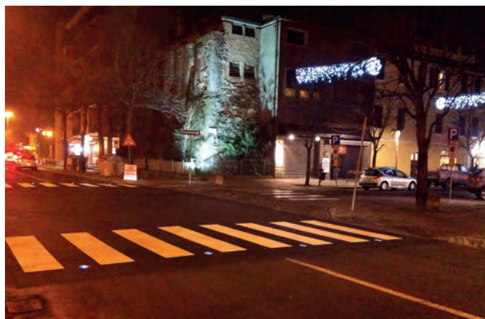
Largo Cairoli con led in notturna

CORREGGIO - VIA MATTEOTTI, 1 - TEL. 0522 / 692025 / 30