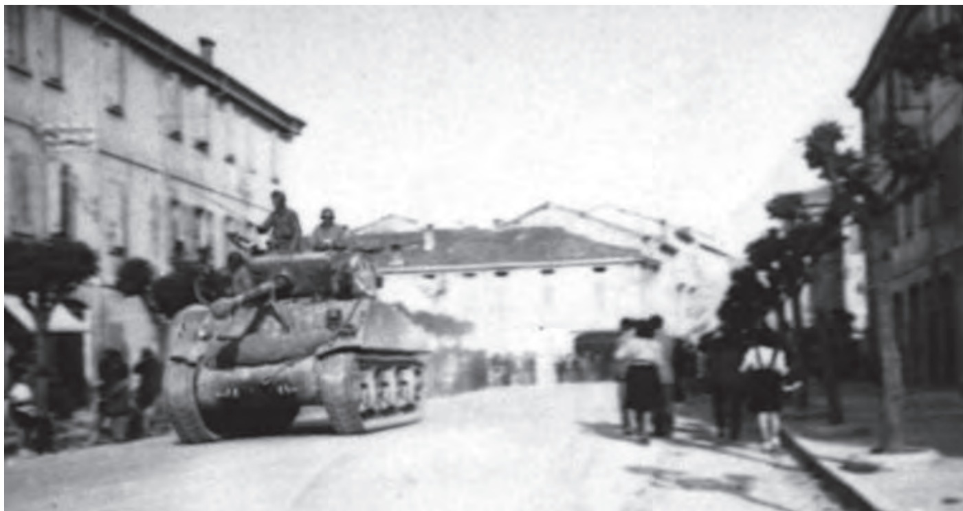
La Liberazione a Rubiera, carri armati americani passano per le vie del centro.

Assessore Lusvardi: "La memoria rende la storia maestra di vita"