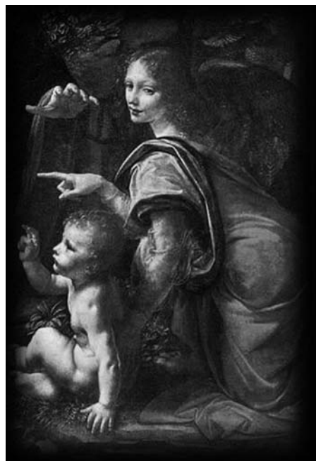
Leonardo Da Vinci

torico che prenderà il via dal Forte per svilupparsi lungo i portici e le vie del centro storico. Anche all'interno dei negozi, infatti, hanno trovato collocazione riproduzioni dei dipinti del Rinascimento italiano ed europeo tra '400 e '500. Un modo per celebrare il Natale attraverso un linguaggio universale, quello dell'arte, il cui valore è apprezzato e riconosciuto da tutti.