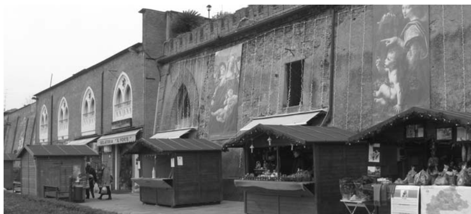
Piazza XXIV Maggio

Tanti appuntamenti promossi dall'Amministrazione comunale, attraverso la collaborazione degli Assessorati al Commercio e Turismo, alla Cultura e alle Politiche Giovanili, ma realizzati insieme alla città, ai suoi cittadini e ai diversi soggetti che in vari settori ope-