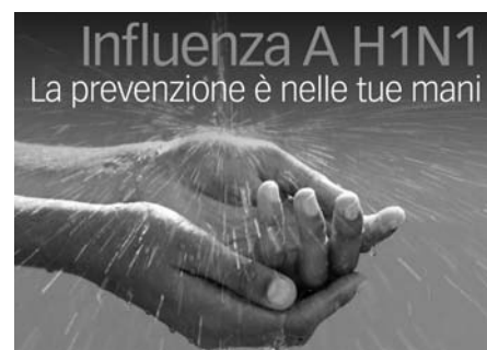
La campagna informativa di prevenzione della Regione Emilia-Romagna