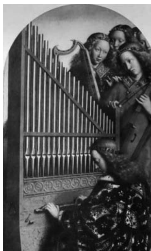
Jan Van Eyck