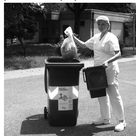
A Rubiera si differenzia anche nelle mense scolastiche

Chiediamo ai cittadini di continuare in comportamenti sempre più virtuosi ed attenti: collaboriamo per un mondo più pulito.