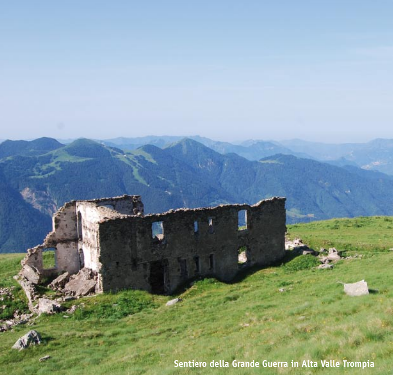
Sentiero della Grande Guerra in Alta Valle Trompia