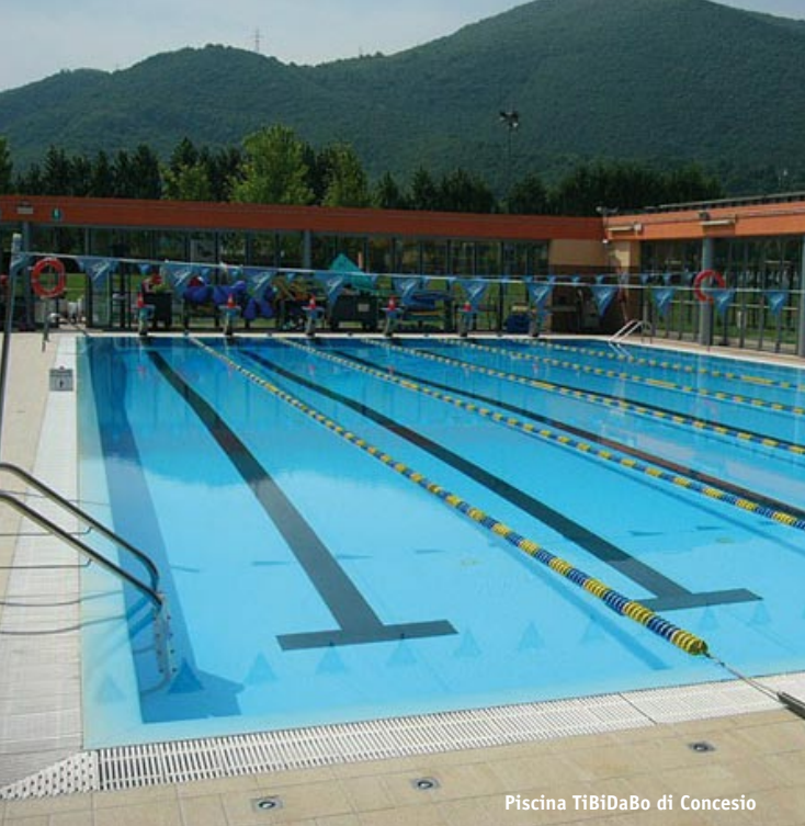
Piscina TiBiDaBo di Concesio