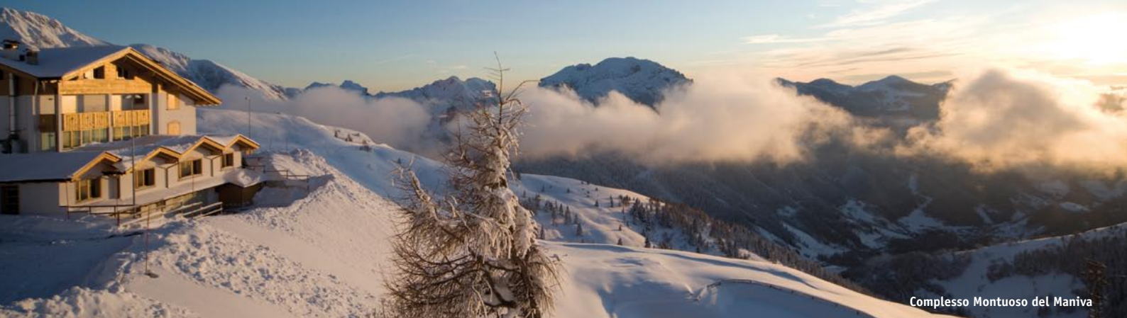
Complesso Montuoso del Maniva