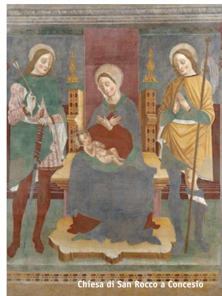
Chiesa di San Rocco a Concesio

Although today things have partially changed in these places on January you can still breathe the celebration air, thanks to celebration of Mass and enchantment traditional auction, ritual fields and salt blessing, dances and folk songs, which take place at the pub in the next few days of the anniversary.