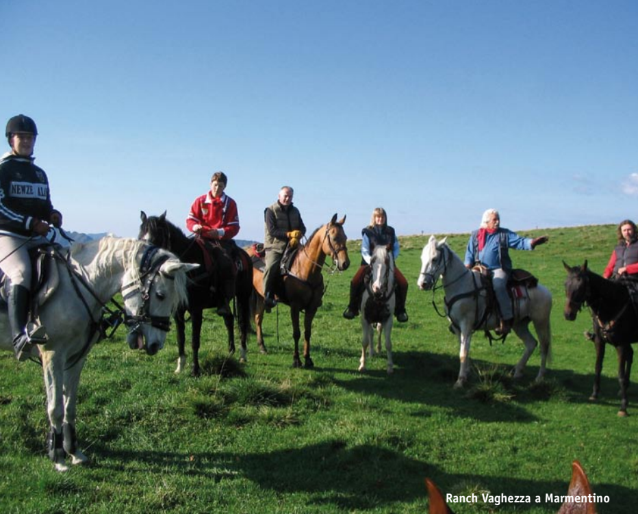
Ranch Vaghezza a Marmentino