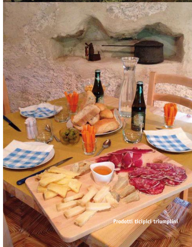
Prodotti tipici triumplini