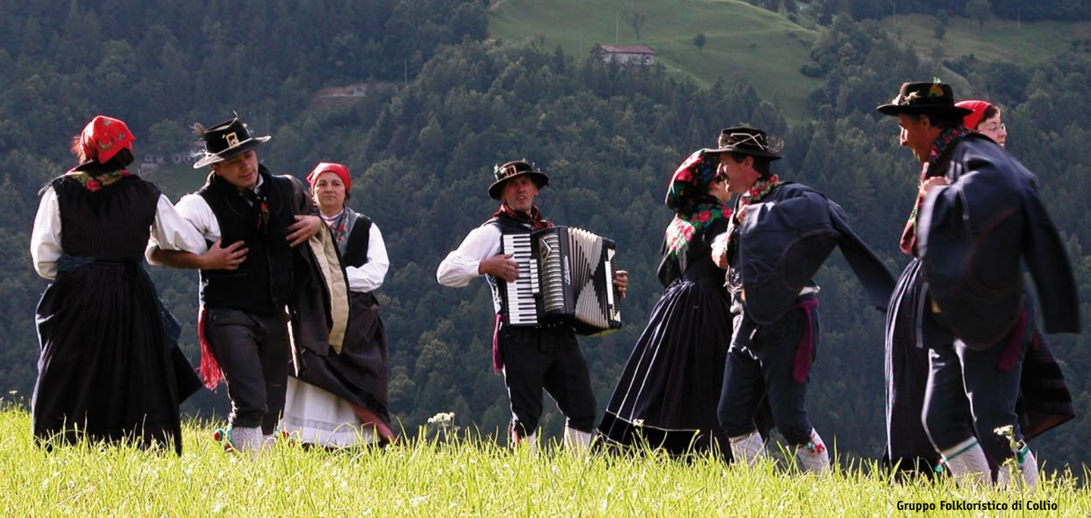
Gruppo Folkloristico di Collio