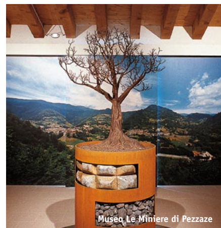
Museo, Le Miniere di Pezzaze

Even today, despite the mining of the valley has now been concluded the charming festival dedicated to the Saint is still celebrated in December. On this occasion, it is possible to attend the mass celebrated in the Marzoli Mine tunnels and that in the Santa Barbara chapel in Marmentino, where the appeal of the living ritual" is celebrated with the presence of one of the more substantial community of ex-miners in Italy.