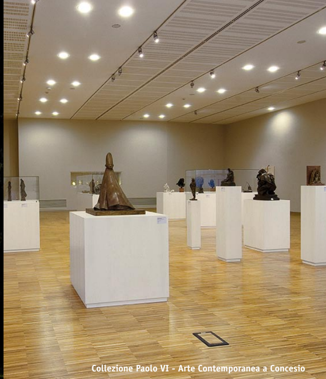
Collezione Paolo VI - Arte Contemporanea a Concesio