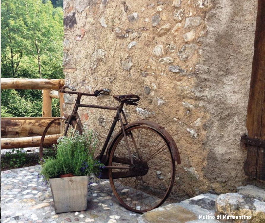
Molino di Marmentino