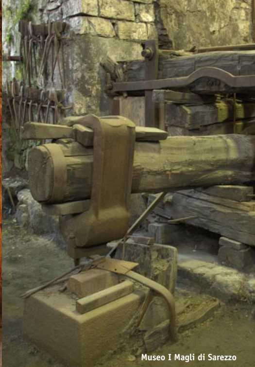
Museo I Magli di Sarezzo