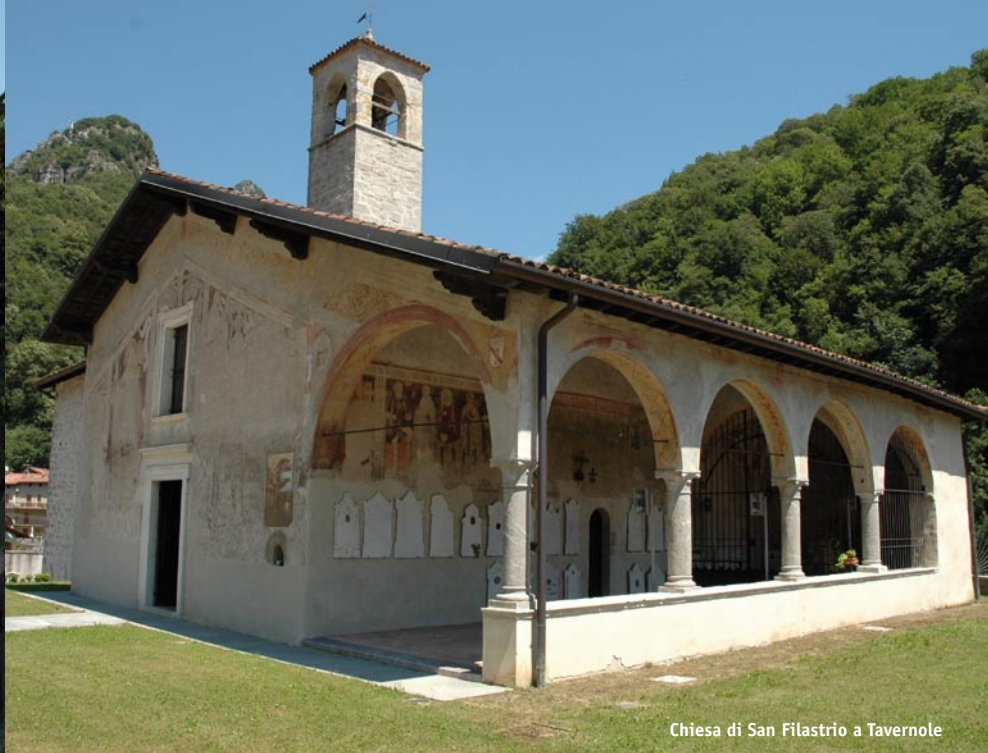
Chiesa di San Filastrio a Tavernole