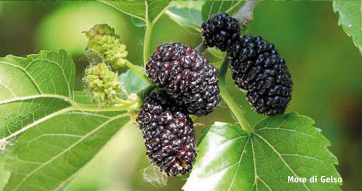
More di Gelso