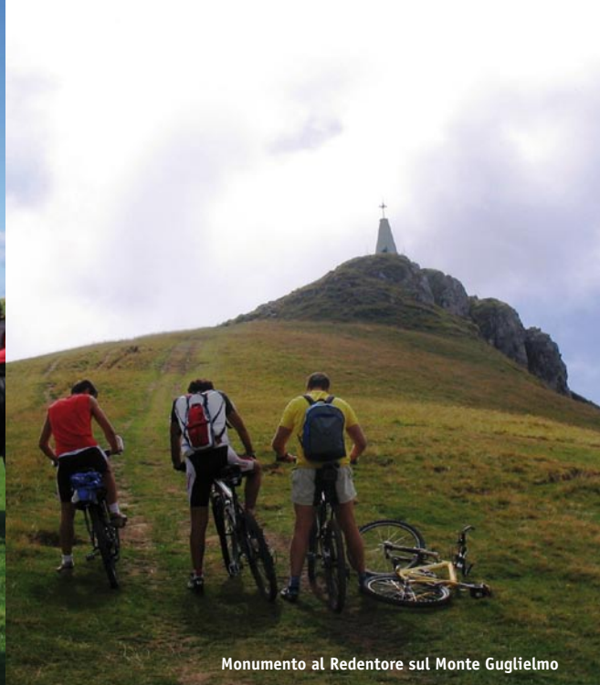
Monumento al Redentore sul Monte Guglielmo