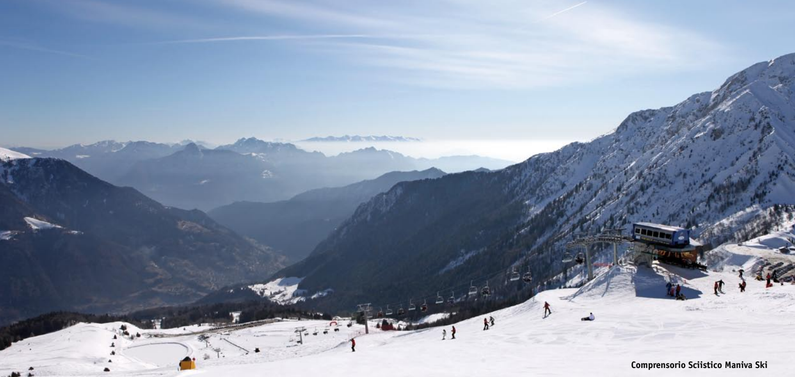
Comprensorio Sciistico Maniva Ski