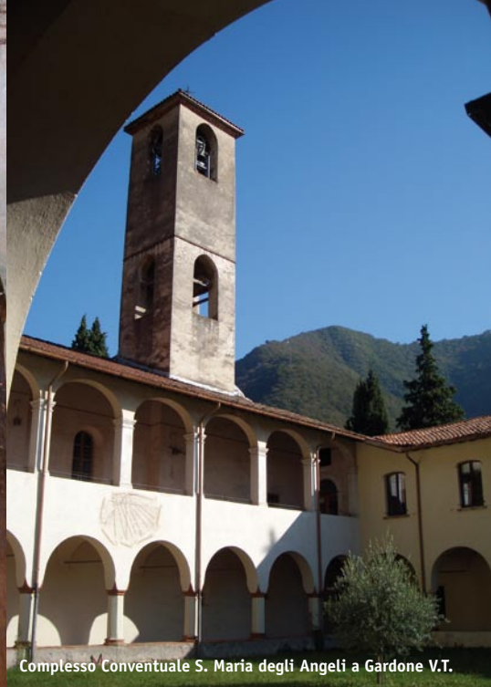
Complesso Conventuale S. Maria degli Angeli a Gardone V.T.