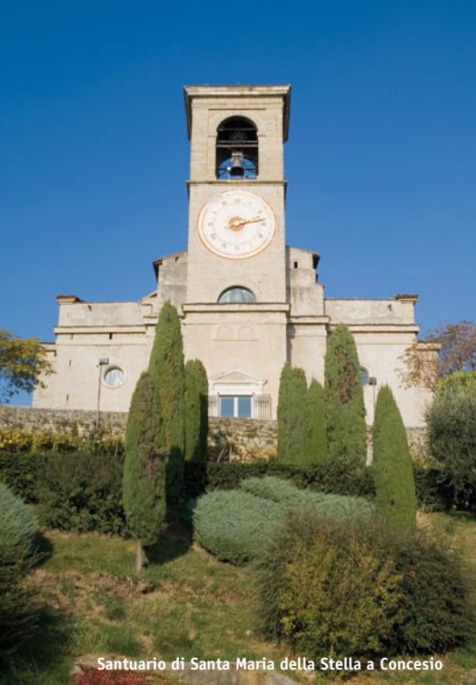
Santuario di Santa Maria della Stella a Concesio