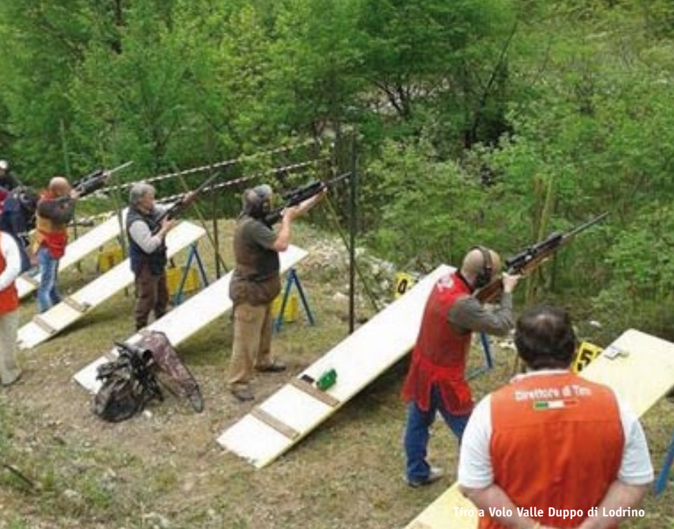
Tiro a Volo Valle Duppo di Lodrino