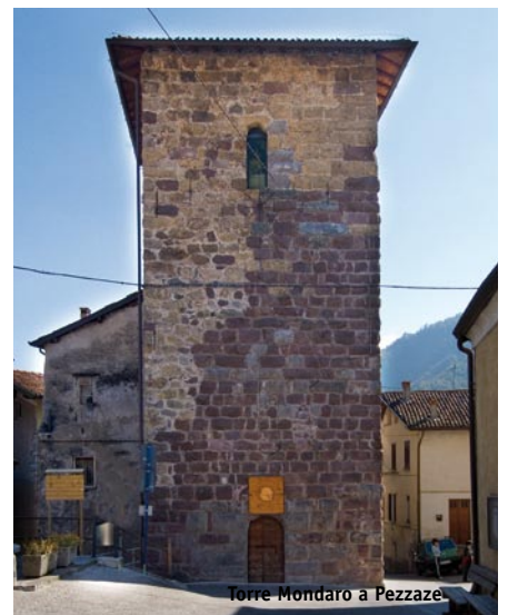
Torre Mondaro a Pezzaze

Fun and recreation that this place offers is completed by a Fairy library: an exhibition of the best children's books about the theme of the year.