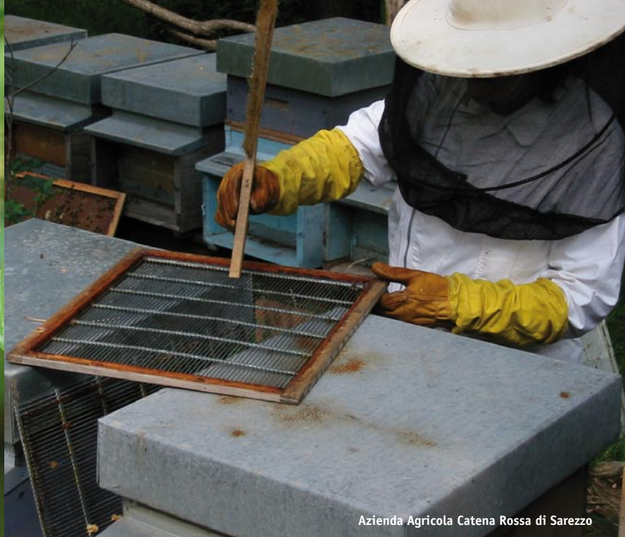
Azienda Agricola Catena Rossa di Sarezzo