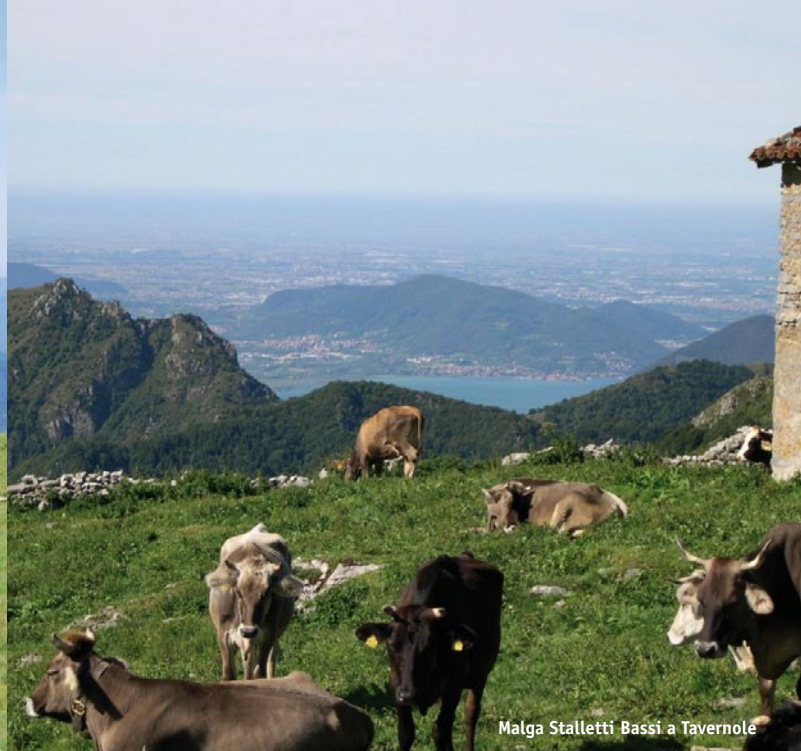
Malga Stalletti Bassi a Tavernole