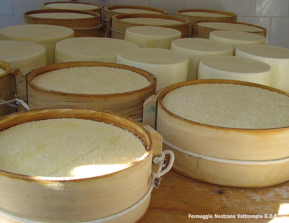
Formaggio Nostrano Valtrompia D.O.P.