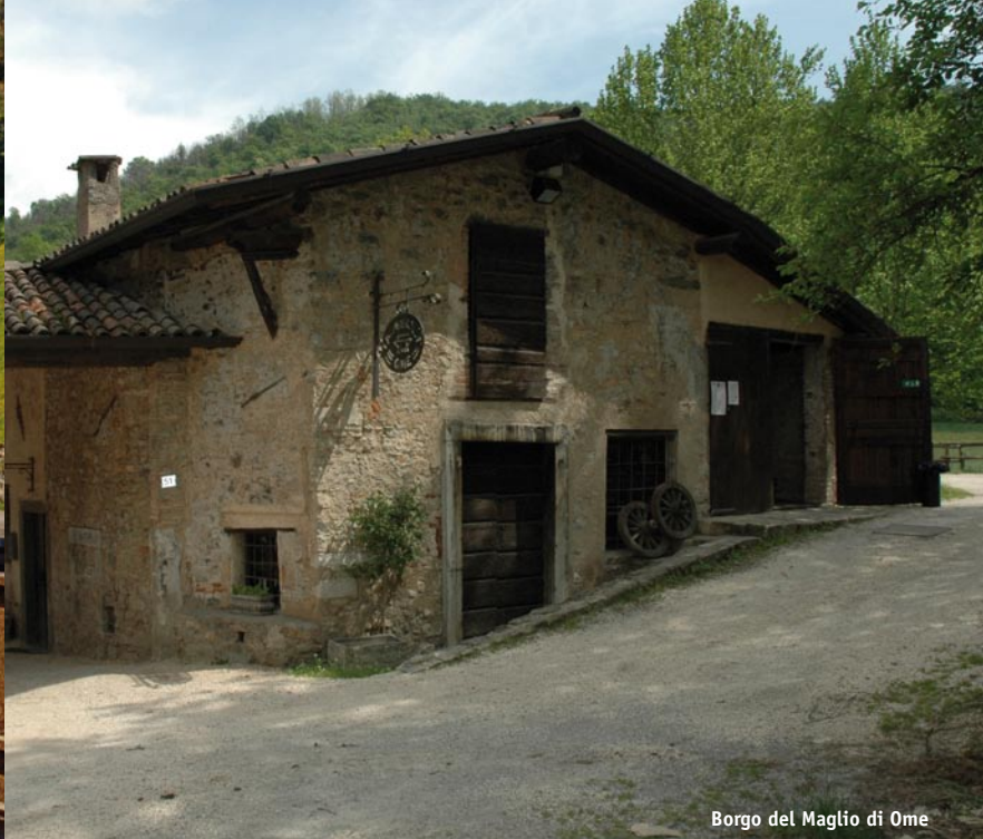
Borgo del Maglio di Ome