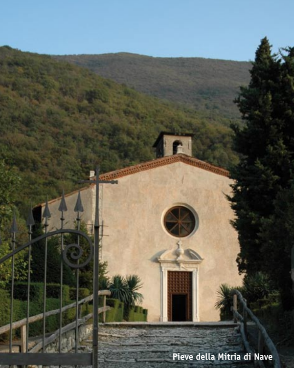
Pieve della Mitria di Nave