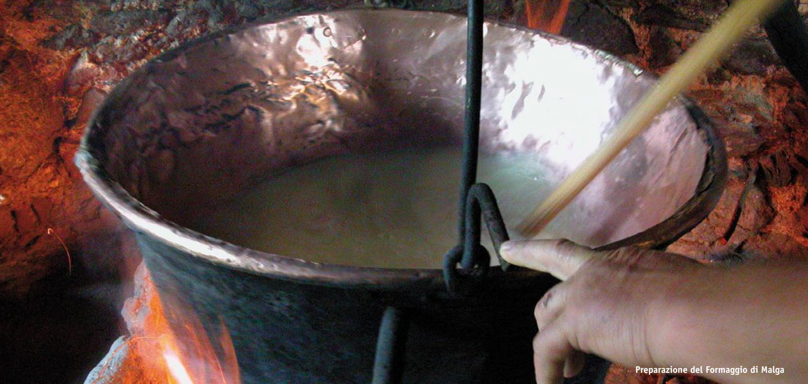
Preparazione del Formaggio di Malga