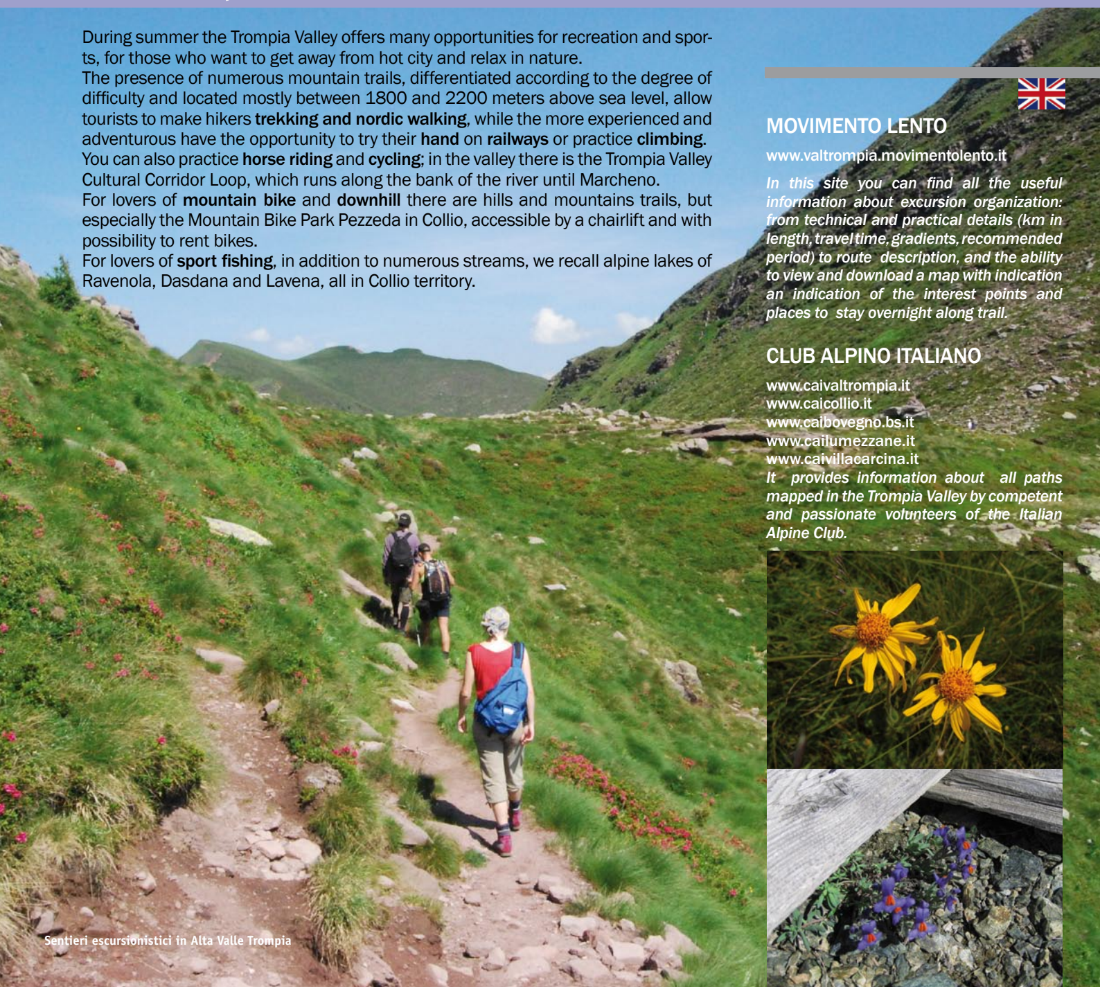
Sentieri escursionistici in Alta Valle Trompia

It provides information about all paths mapped in the Trompia Valley by competent and passionate volunteers of the Italian Alpine Club.