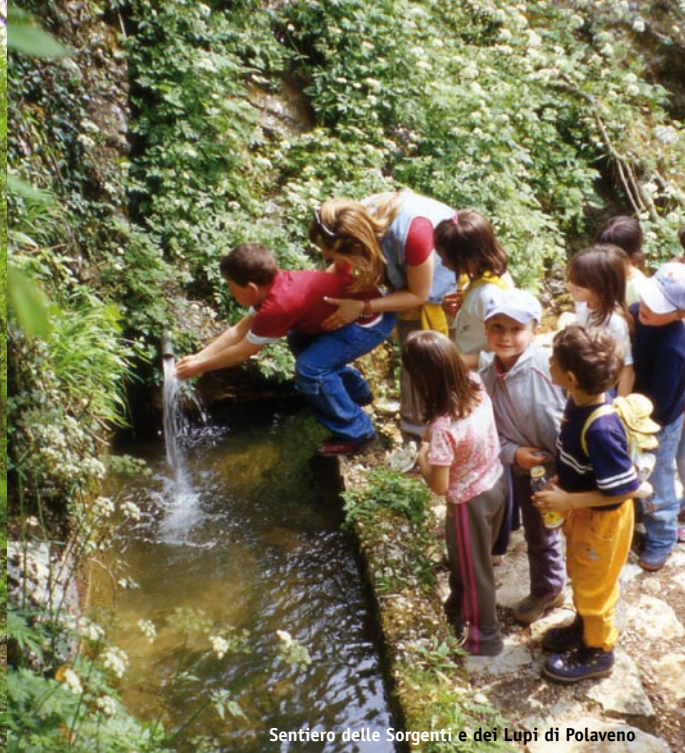
Sentiero delle Sorgenti e dei Lupi di Polaveno