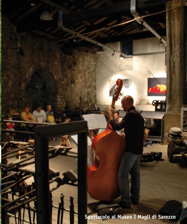
Spettacolo al Museo I Magli di Sarezzo