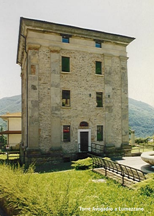
Torre Avogadro a Lumezzane