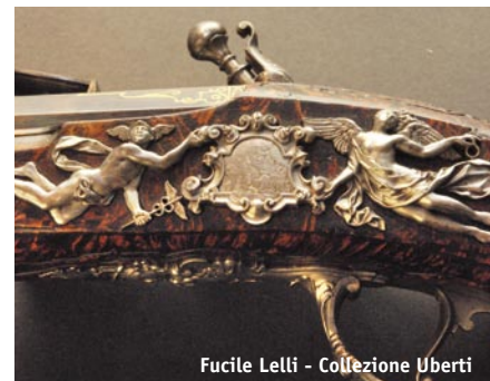
Fucile Lelli - Collezione Uberti

Ancora oggi, nonostante l'attività estrattiva della valle si sia ormai conclusa, nel mese di dicembre si celebra la suggestiva festa dedicata alla Santa. In tale occasione è possibile assistere alla messa celebrata all'interno delle gallerie della Miniera Marzoli di Pezzaze e a quella presso la cappella di Santa Barbara a Marmentino, dove è previsto anche il rituale appello dei vivi, affidato alla presenza di una delle più corpose comunità di ex-minatori d'Italia.