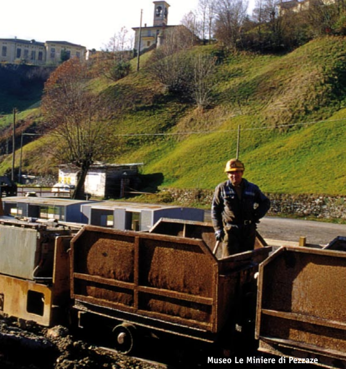
Museo Le Miniere di Pezzaze