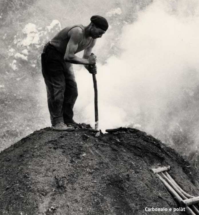
Carbonaio e poiât