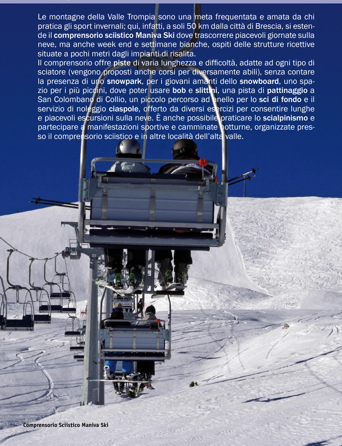
Comprensorio Sciistico Maniva Ski

Siti che offrono informazioni utili su tutti i sentieri mappati in Valle Trompia dai competenti ed appassionati volontari del Club Alpino Italiano.