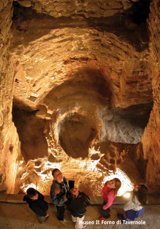
Museo Il Forno di Tavernole