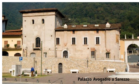
Palazzo Avogadro a Sarezzo

L'offerta ludico-ricreativa di questo luogo, in bilico tra magia e realtà, si completa con la Biblioteca delle Favole, esposizione dei migliori libri per bambini sul tema dell'anno.