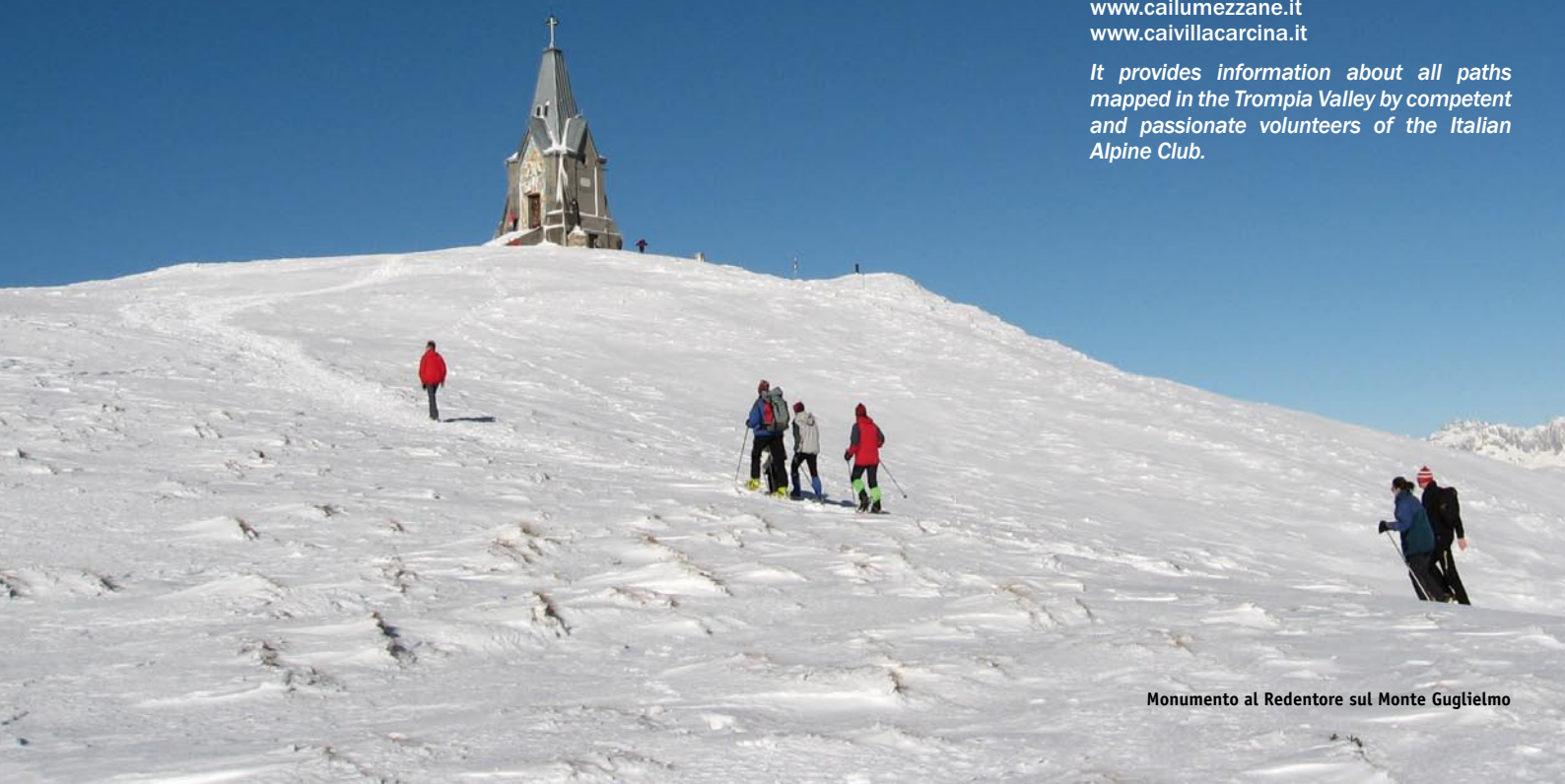
Monumento al Redentore sul Monte Guglielmo

It provides information about all paths mapped in the Trompia Valley by competent and passionate volunteers of the Italian Alpine Club.