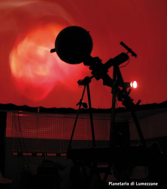
Planetario di Lumezzane