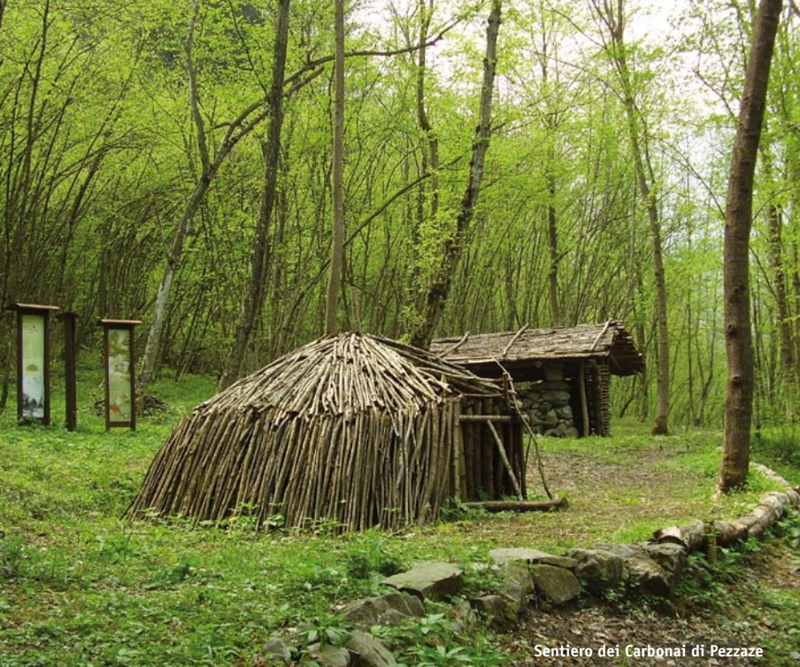
Sentiero dei Carbonai di Pezzaze