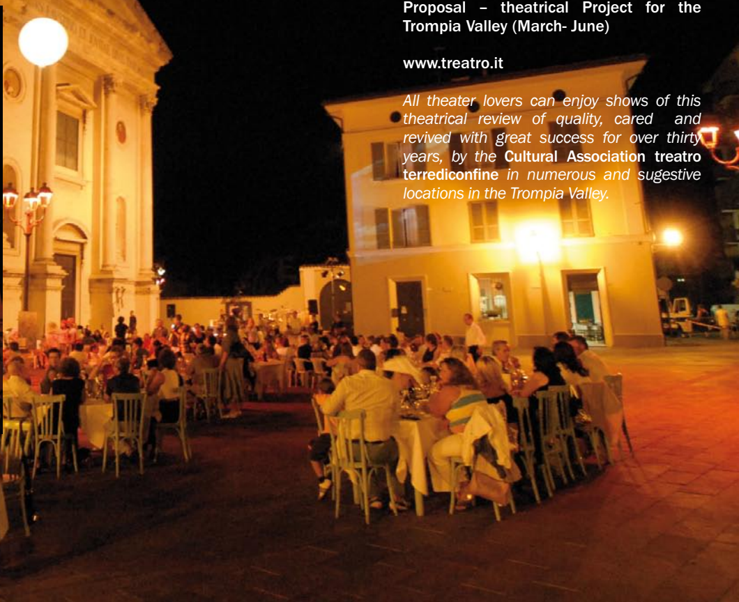
Piazza Cesare Battisti a Sarezzo