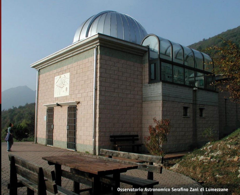
Osservatorio Astronomico Serafino Zani di Lumezzane