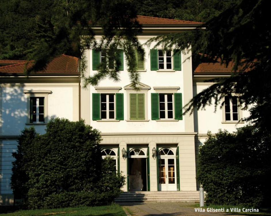
Villa Glisenti a Villa Carcina