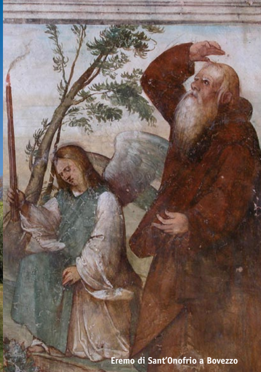
Eremito di Sant'Onofrio a Bovezzo