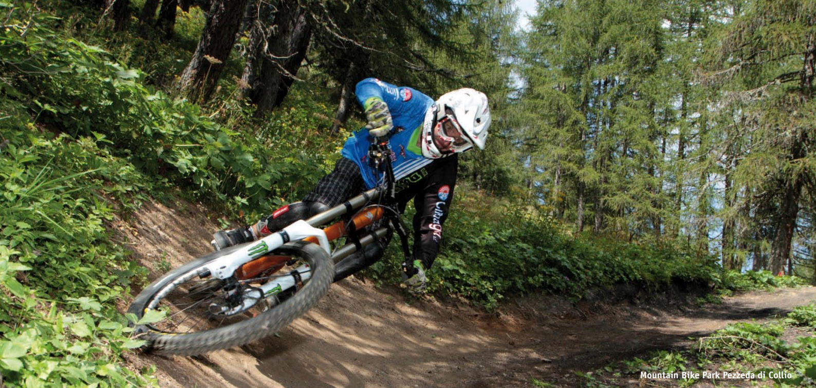
Mountain Bike Park Pezzeda di Collio